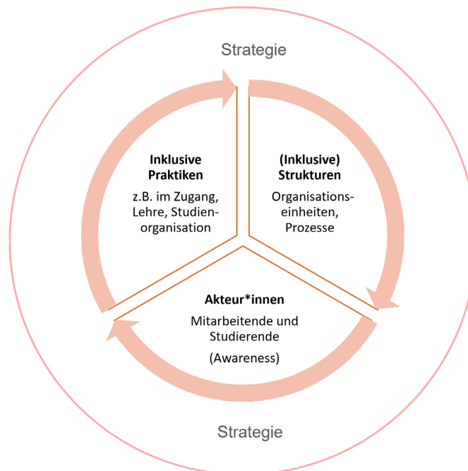
Abbildung 1: Die Verankerung der sozialen Dimension in der Hochschulbildung

Im folgenden Kapitel wird zunächst auf die strategische Verankerung der sozialen Dimension an den Universitäten und Hochschulen eingegangen. Im Weiteren wird thematisiert, wie sich der auf strategischen Rahmenbedingungen basierende Implementierungsprozess innerhochschulisch gestaltet: Welche organisationalen Einheiten sind involviert, wie werden Aufgaben koordiniert und wie erfolgt die Umsetzung von Maßnahmen? Inwieweit gehen letztlich diese Vorgaben in das Handeln der beteiligten Akteur*innen über und entfalten Wirkung?