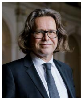
ao. Univ.-Prof. Mag. Dr. Martin Polaschek Bundesminister für Bildung, Wissenschaft und Forschung

Dieser kompetenzorientierte Unterricht soll Schülerinnen und Schülern Fertigkeiten vermitteln, die über das reine Wissen hinausgehen. Sie sollen lernen, Wissen, Können und Handeln zu verbinden. Der Erwerb von Kompetenzen geht also über das reine Wissen hinaus. Anders gesagt: Schülerinnen und Schüler sollen ihr Wissen so anwenden können, dass sie damit zur Problemlösung beitragen können. Die Förderung des Erwerbs und die faire Diagnose von bestimmten von den Schülerinnen und Schülern anwendbaren Fähigkeiten sind Anspruch und Ziel dieses umfassenden Pädagogik-Pakets, durch dessen Reformen sich der Kompetenzbegriff wie ein roter Faden zieht: Er beginnt bei den erstmals bundesweit präzise festgelegten Schulreife kriterien als Grundlage für einen erfolgreichen Schulstart. Gleichzeitig bieten die neuen Lehrpläne für Volksschulen, Mittelschulen und die Unterstufe der AHS durch ihre konsequente Neuausrichtung auf bestimmte Kompetenzen mehr Freiraum für zeitgemäße Inhalte, für Interessengebiete und Schwerpunktsetzungen von